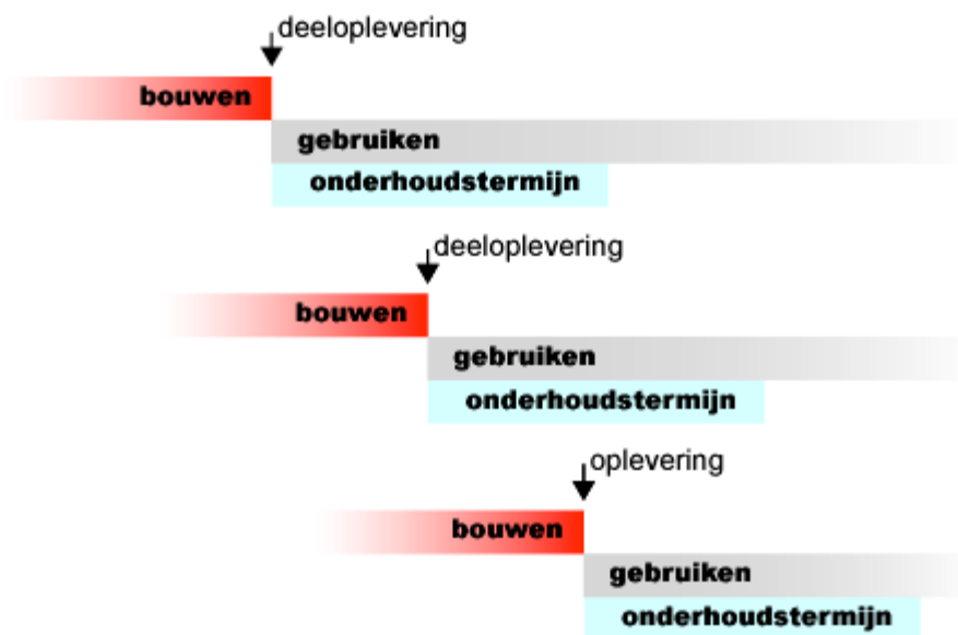
Afbeelding 1: Schematische weergave van de oplevering in drie delen.

De oplevering in delen kan in het bestek worden beschreven in artikel 00.02.08. Met de STABU bepalingen kunnen de afzonderlijk termijnen worden vastgelegd in (werkbare) werkdagen e.d. (bepaling 05), of door het noemen van een datum (bepaling 06).