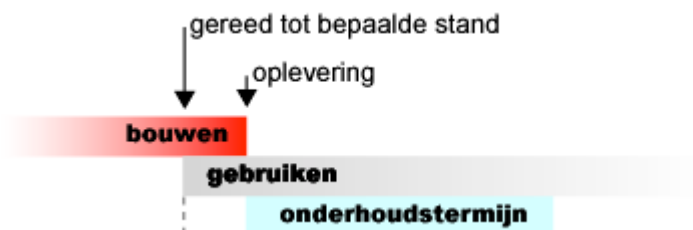
Afbeelding 2: Schematische weergave van de oplevering in drie delen.

van de aannemer dan redelijkerwijs van hem kan worden geveerd, zal dit worden verrekend als meer werk." Het is daarom aan te bevelen, indien vervroegde ingebruikname wordt voorzien, dit in het bestek te vermelden in artikel 00.02.08. Daarbij kan gebruik worden gemaakt van de STABU bepaling 03 (Termijn, uitvoering van het werk tot bepaalde stand) of bepaling 04 (Datum, uitvoering van het werk tot bepaalde stand).